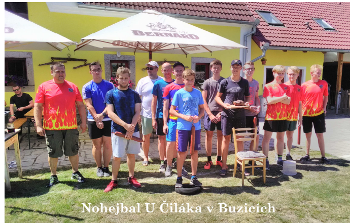
Nohejbal U Čiláka v Buzicích