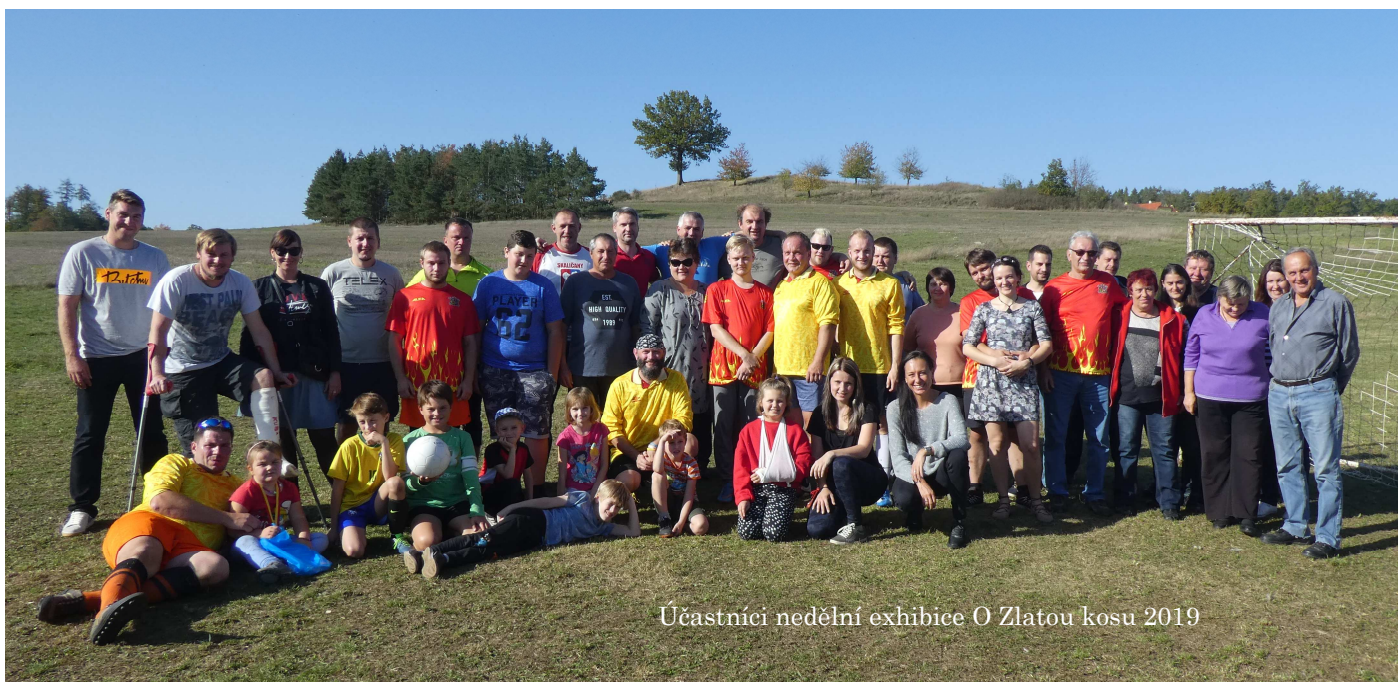
Účastníci nedělní exhibice O Zlatou kosu 2019