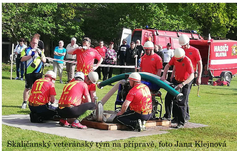
Skaličanský veteránský tým na přípravě