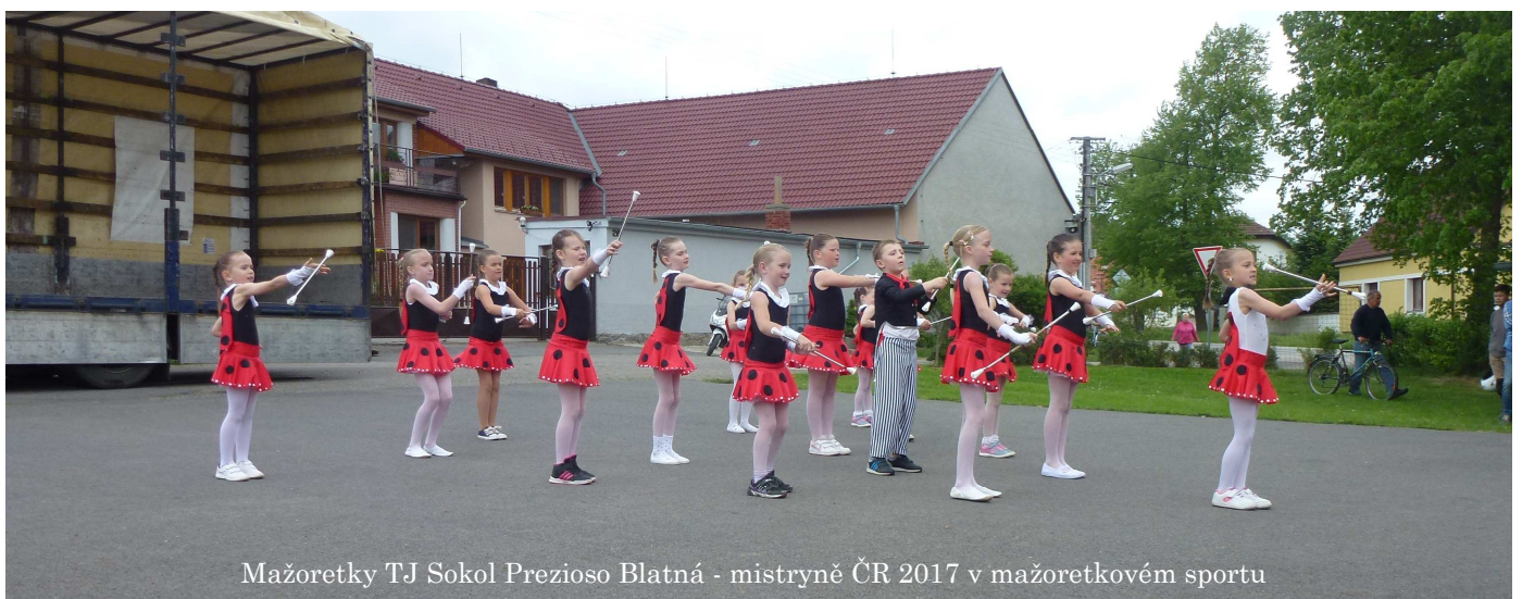
Mažoretky TJ Sokol Prezioso Blatná - mistryně ČR 2017 v mažoretkovém sportu