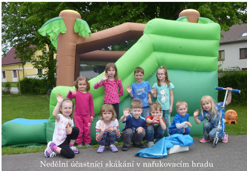
Nedělní účastníci skákání v nafukovacím hradu