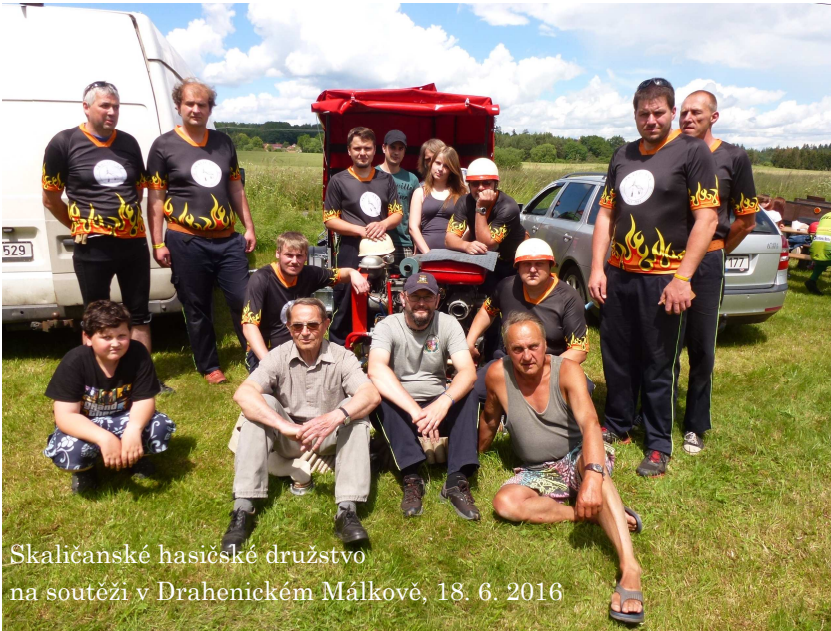
Skaličanské hasičské družstvo na soutěži v Drahenickém Málkově, 18. 6. 2016

Místní hasičský sbor se v roce 2015 zúčastnil celkem 8 soutěží v požárním útoku, na nichž zaznamenal 18 soutěžních pokusů. Z tohoto snažení a utužování akceschopnosti vzešly 3 poháry za první místo a 3 poháry za místo druhé (všechny medailové posty byly získány v kategorii veteráni). Vzhledem k disponování nejstarší soutěžní mašinou a věkovým složením týmu se jedná o vynikající úspěchy. Rok 2016 byl na pořádání soutěží poněkud chudší, nicméně i tak jsme se účastnili 5 soutěží s dobitím dvou vítězství a jednoho druhého místa. Rok 2016 znamenal pro sbor celkem 13 startů v požárním útoku a vylepšení časů zejména v kategorii na 2B. Všeobecně známým zvykem našeho sboru již je tradiční oslavný skok do Rybníčku v případě našeho vítězství. Nejinak tomu bylo v letošním roce dne 11. 9. v 1:30 hod.