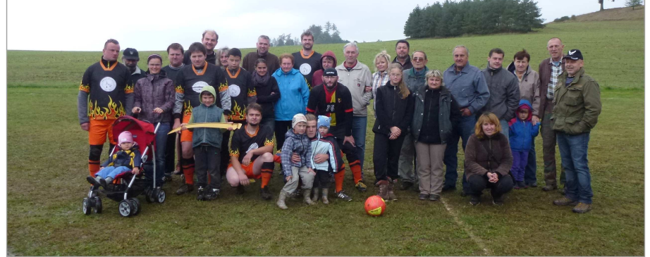
Posvícenská exhibice O Zlatou kosu Skaličany 9. 10. 2016

ten dobrý výsledek, tím lépe, nicméně podstatné je dobře se bavit a realizovat coubertenovské tradice, že není důležité zvítězit, ale zúčastnit se. Tým není uzavřen nikomu a každý se může zapojit, chce-li. O posvícenském fotbalovém turnaji píšeme článek v dvouměsíčníku SOBě (aktuální číslo vychází koncem listopadu) a tak není nutné rekapitulovat či se opakovat, nicméně lze zmínit a vyzdvihnout několik faktů. Jedním z nich je, že se sešla celkem dobrá parta, jak v sobotní, tak v nedělní části posvícenského turnaje a i přes mizerné chladné a deštivé počasí byla i účast diváků velice slušná, jak na sportovní, tak i při společenské části, kterou dokonale zpestřilo trio hudebníků ze souboru KAREL. Poměrně příkladnou ukázkou dobré nálady byla nedělní exhibice starých Kozlů proti mladým Kozlíkům, kde věk nejstaršího a nejmladšího hráče turnaje dělilo více než pět desetiletí. Poděkování za téměř perfektní organizaci patří všem, kteří se podíleli na přípravách, shánění odměn, úklidu i těm, kteří jen přišli v duchu dobré sousedské pospolitosti posedět, pohovořit, pobavit se. Díky Vám všem!