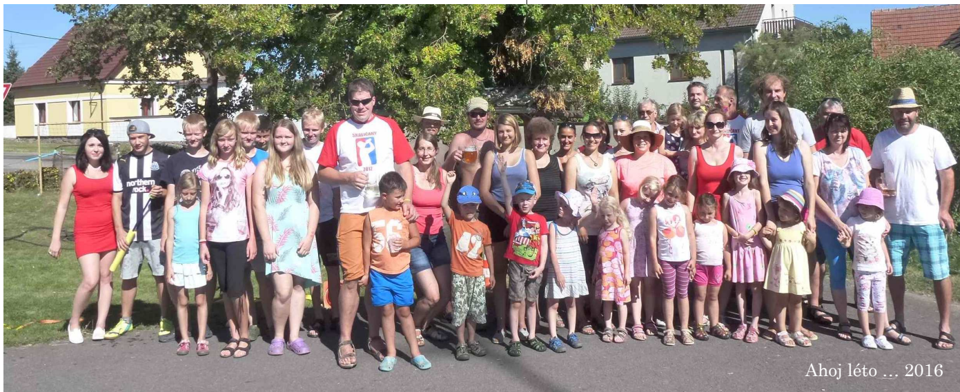
Ahoj léto ... 2016