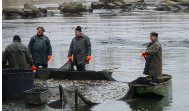
Jarní výlov na Pejše, 2012

V obecních vývěskách je zveřejněna informace Finančního úřadu o splatnosti daně z nemovitosti a o zasílání složenek.