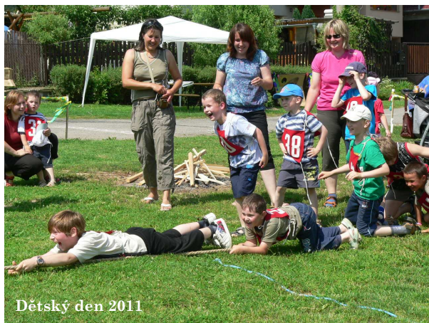
Dětský den 2011