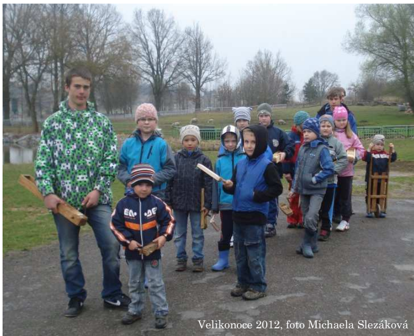
Velikonoce 2012